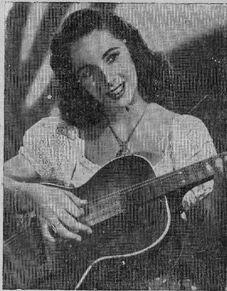
ELIZABETH TAYLOR, la popularísima estrella de cine, que espera el primer hijo de su nuevo matrimonio con el director de cine Mike Todd.

La maternidad, aquel don más preciado que nos brinda la naturaleza, ese don que tan sólo nos pertenece a nosotras, las mujeres, nos eleva a los ojos del hombre que admira nuestro tesón y nuestra paciencia sin límites, durante el compás de espera, soportándolo todo con la sonrisa en los labios y la alegría desbordante de nuestro corazón amante que empieza ya a querer.