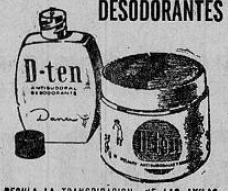
REGULA LA TRANSPIRACION DE LAS AXILAS Y LAS DESODORIZA POR VARIAS DIAS.

ricano, pues ODECA es el organismo más capaz, más activo y mayormente interesado en auspiciar estas actividades."